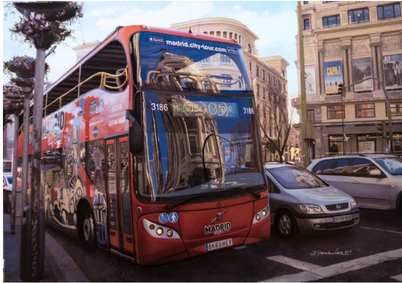
“Reflejos en el bus turístico” de AGUSTIN GONZALEZ SALVADOR