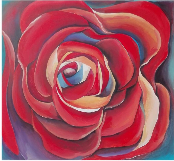
“Flor roja” de VICENTE SOTO