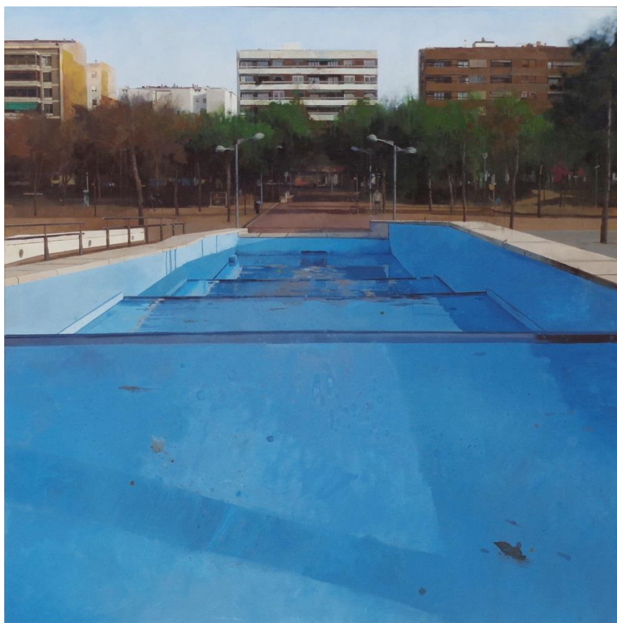
Paisaje urbano: Homenaje a Pierre Mondrián, de FRANCISCO ESCALERA

Cuyo autor es: FRANCISCO ESCALERA GONZALEZ (Córdoba)