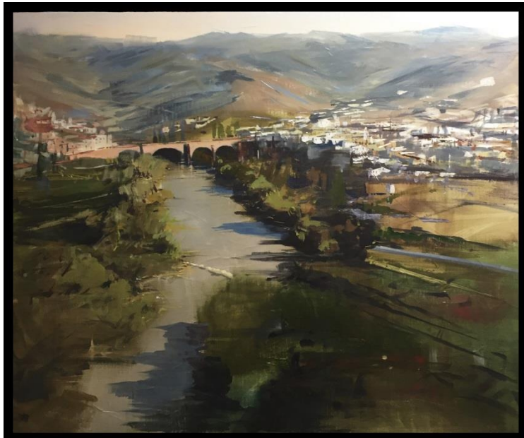
“Allá van los sueños”, de PACO ROJAS