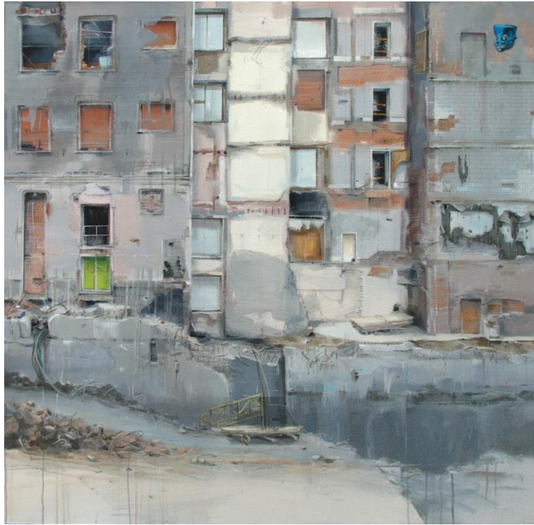
“Demo” de LETICIA GASPAR