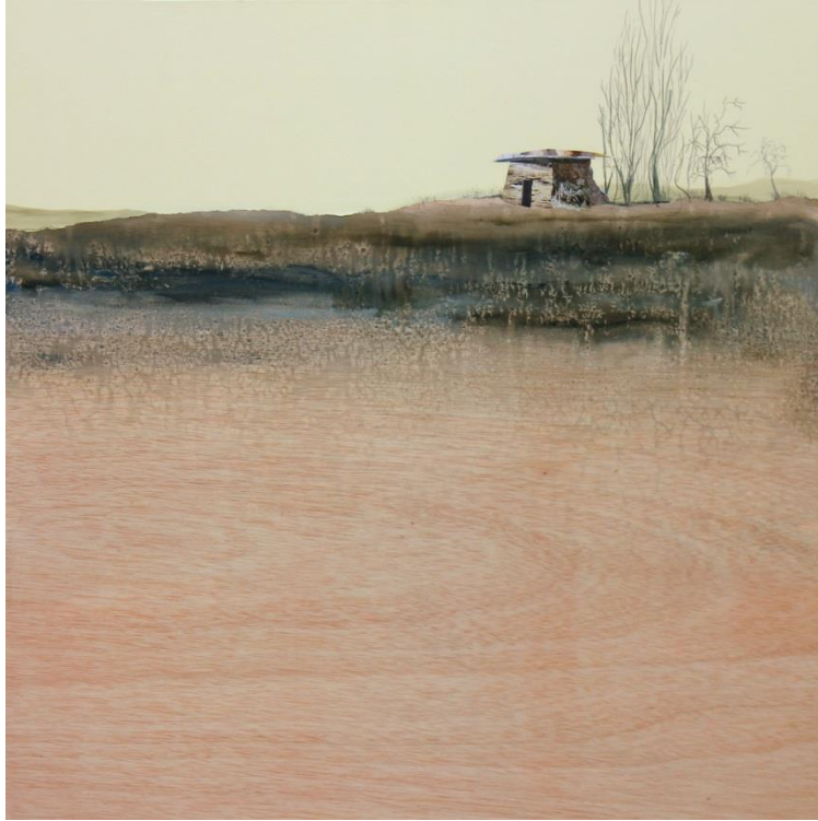
“En un misterioso prado”, de EDUARDO GOMEZ