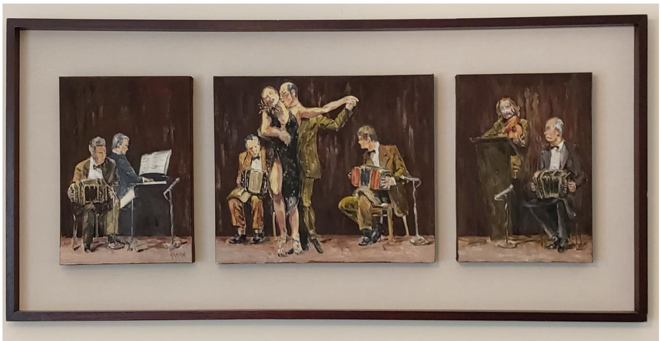
“Tríptico” S.N. de ESTHER KAPLAN