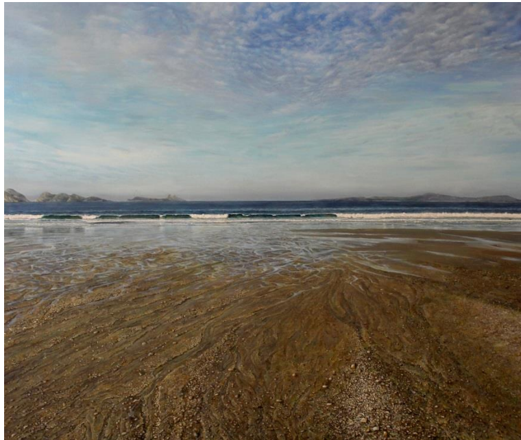
“No se puede pintar toda la arena de la playa”, de DANIEL PERNAS