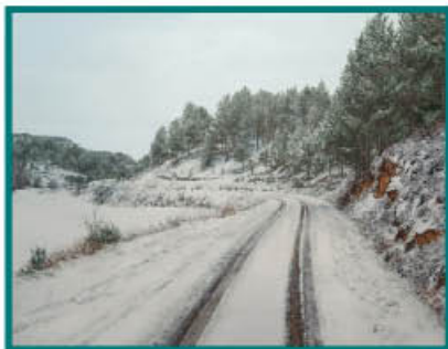
"Rastro Blanco" Autor: Guillermo Sedano Vivanco