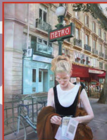
"Saint-Michel, Paris" - Autora: SANDRA VALLS TRAYER PREMIO DIEGO DE LOSADA DE PINTURA 2025